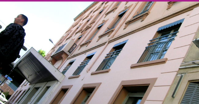
LA RÉSIDENCE LE BORDEAUX