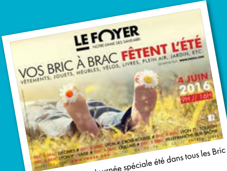
■ 4 juin 2016: Journée spéciale été dans tous les Bric à Brac du FOYER