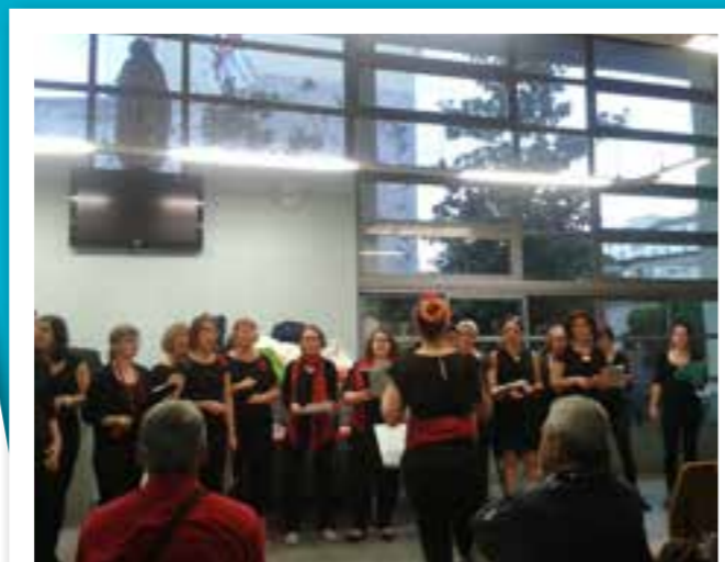
■ 14 Juin 2016: Concert Gospel avec la MJC Jean Macé au Centre Gabriel ROSSET