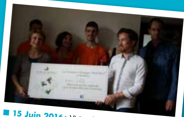
■ 15 Juin 2016: Visite de la Fondation Georges TRUFFAUT et remise officielle d'un chèque pour le soutien du projet « Un jardin sur le toit de Perrache » avec Unis Cité Rhône-Alpes.