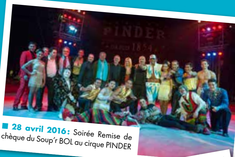
■ 28 avril 2016: Soirée Remise de chèque du Soup'r BOL au cirque PINDER