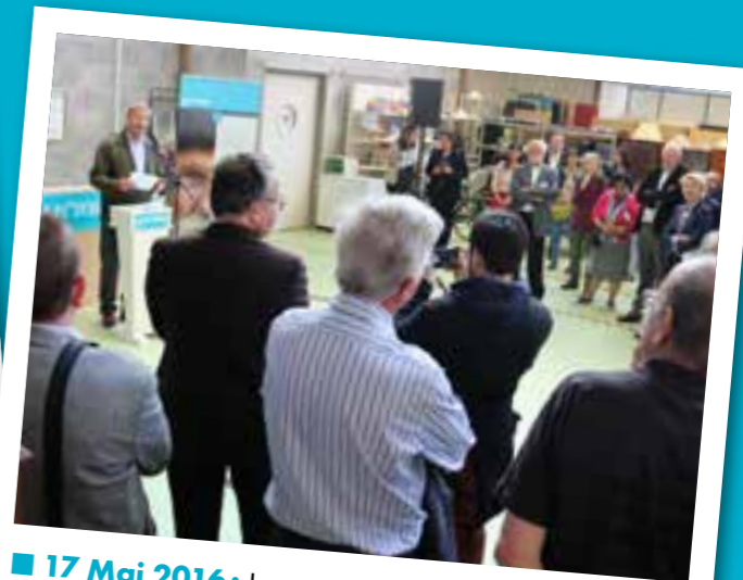
■ 17 Mai 2016: Inauguration du dernier Bric à Brac du FOYER, situé 17 Rue de TOULON (LYON 7e)