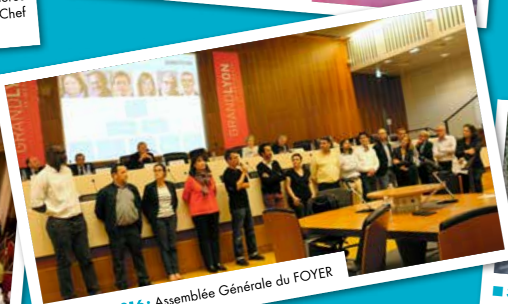
■ 26 mai 2016: Assemblée Générale du FOYER