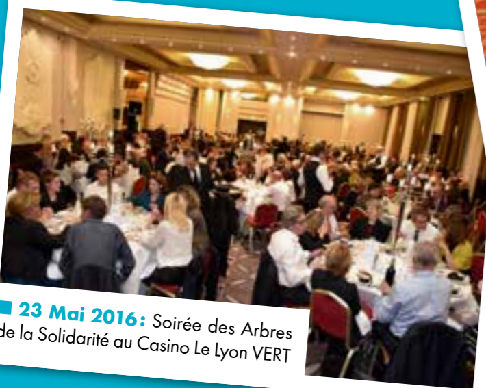
■ 23 Mai 2016: Soirée des Arbres de la Solidarité au Casino Le Lyon VERT