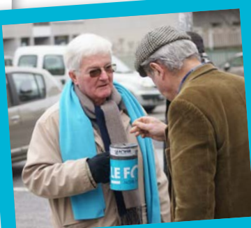
■ 16 ET 17 FÉVRIER: Quête du FOYER dans le département du Rhône. Merci aux 800 bénévoles qui se sont mobilisés pour aller à la rencontre des généreux donateurs!