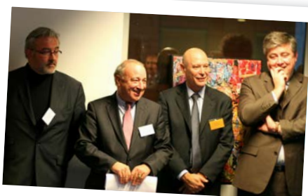
■ 13 DÉCEMBRE: LE FOYER a été invité par le MEDEF Lyon Rhône à présenter ses actions lors d'une réunion avec les entreprises de la Région.