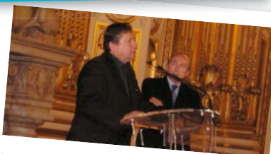
■ 4 FÉVRIER: Gérard COLLOMB a invité les bénévoles des associations œuvrant auprès des plus démunis pour les remercier de leur engagement.