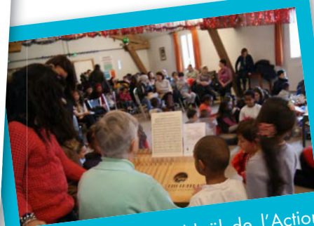
■ 19 DÉCEMBRE: Noël de l'Action Familiales à la Chardonnière