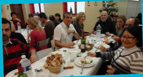
■ 5 JANVIER: Repas de fête à l'Accueil de Jour Saint Vincent.