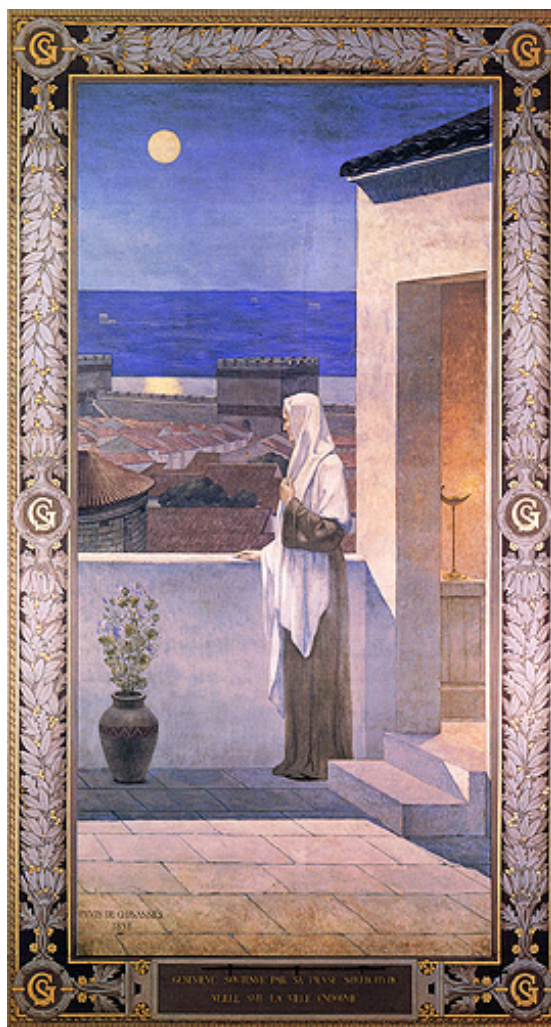
GENEVIÈVE VEILLANT SUR PARIS - PIERRE PUVIS DE CHAVANNES

ce chef d'œuvre de l'art sans avoir le désir et l'inquiétude de remplir son rôle de veilleur dans un monde enténébré [...], dans une ville gorgée de richesses qui rejette les pauvres, les