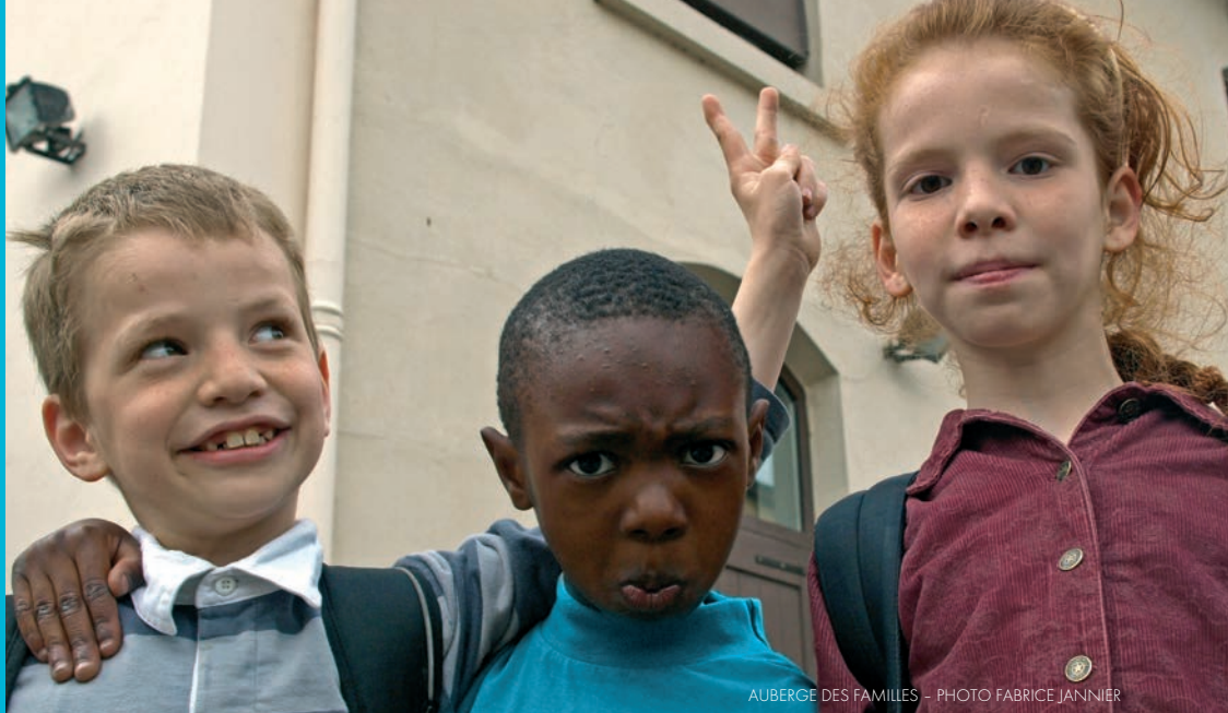
AUBERGE DES FAMILLES