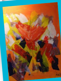
■ 4 AU 8 FÉVRIER: Exposition en partenariat avec la mairie de LYON 3eme et l'EHPAD « Ma Demeure » des œuvres réalisées lors du « WORKSHOP 2012 ».