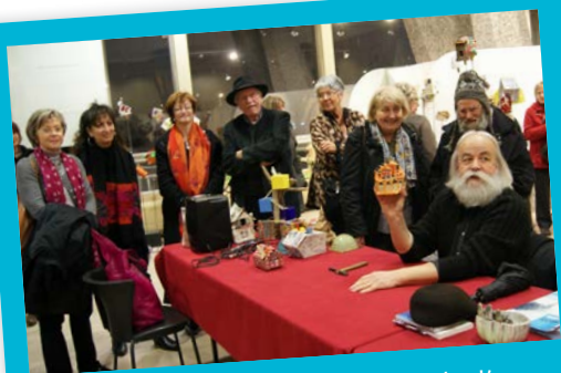
■ 13 DÉCEMBRE: Vernissage de l'exposition BESOIN DE TOI(T) et vente aux enchères des cabanes précieuses réalisées par le collectif Singul'Art en partenariat avec la ville de Lyon 8eme et la MJC de BRON.