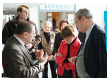
■ 11 FÉVRIER: Visite au Centre Gabriel ROSSET de Madame Michèle DELAUNAY, Ministre déléguée aux Affaires Sociales et à la Santé, chargée des Personnes Âgées et de l'Autonomie.