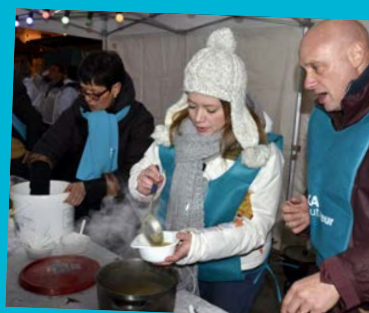
■ 21 FÉVRIER: Soup'R BOL place de la République Lyon 2 ème .