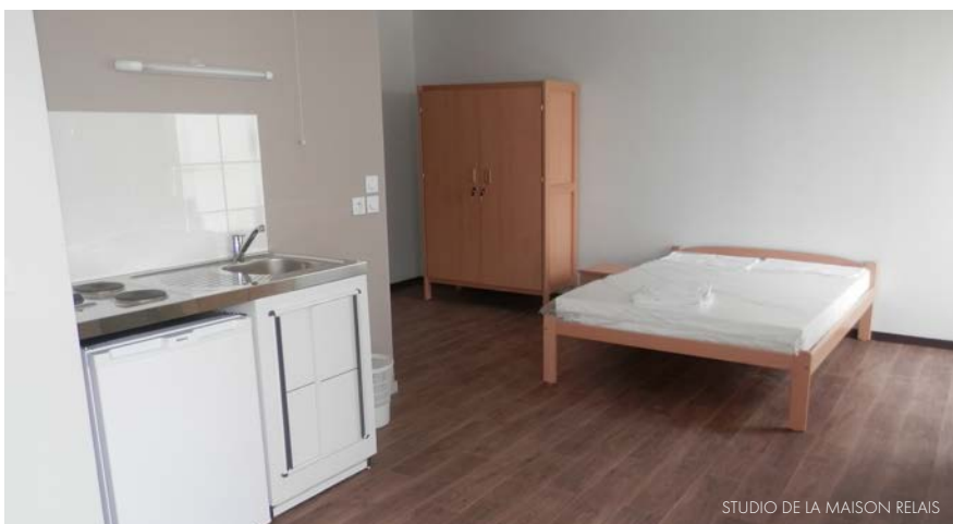
STUDIO DE LA MAISON RELAIS

Accompagner ces familles vers le logement, les ressources et la santé, voici l'objectif de l'association. Et, pourquoi pas, vers un logement dans le bâtiment d'en face ? ■