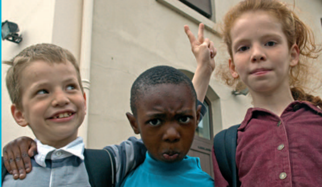
Auberge des Familles