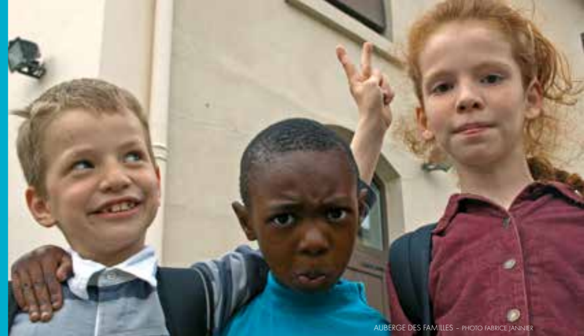
AUBERGE DES FAMILLES