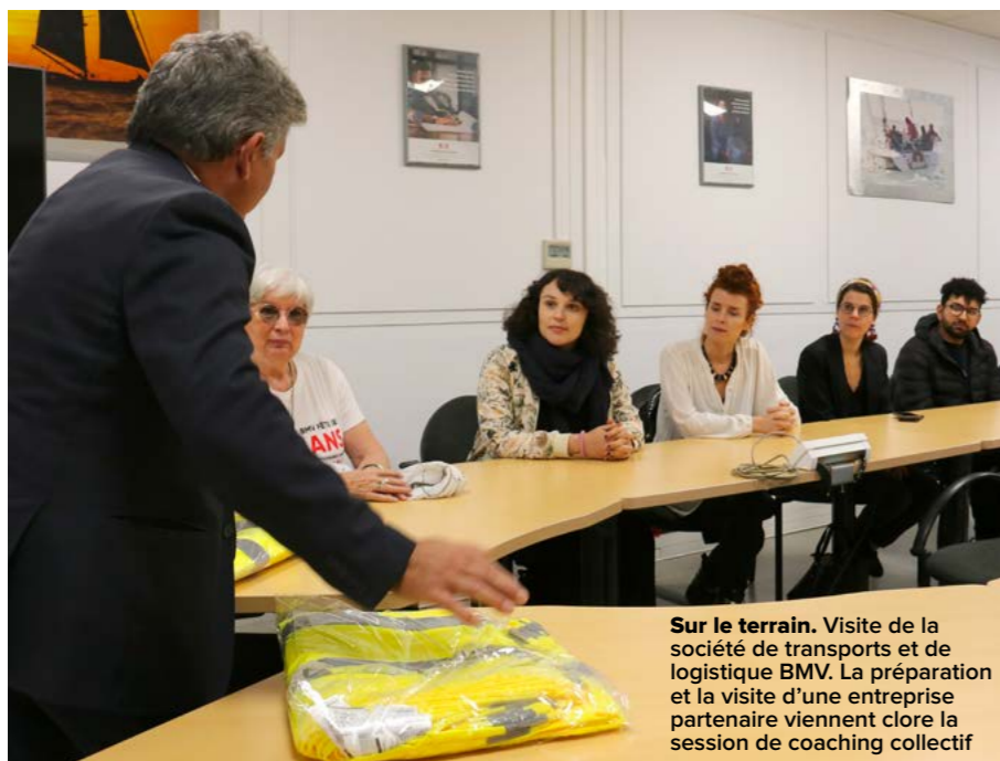
Sur le terrain. Visite de la société de transports et de logistique BMV. La préparation et la visite d'une entreprise partenaire viennent clore la session de coaching collectif