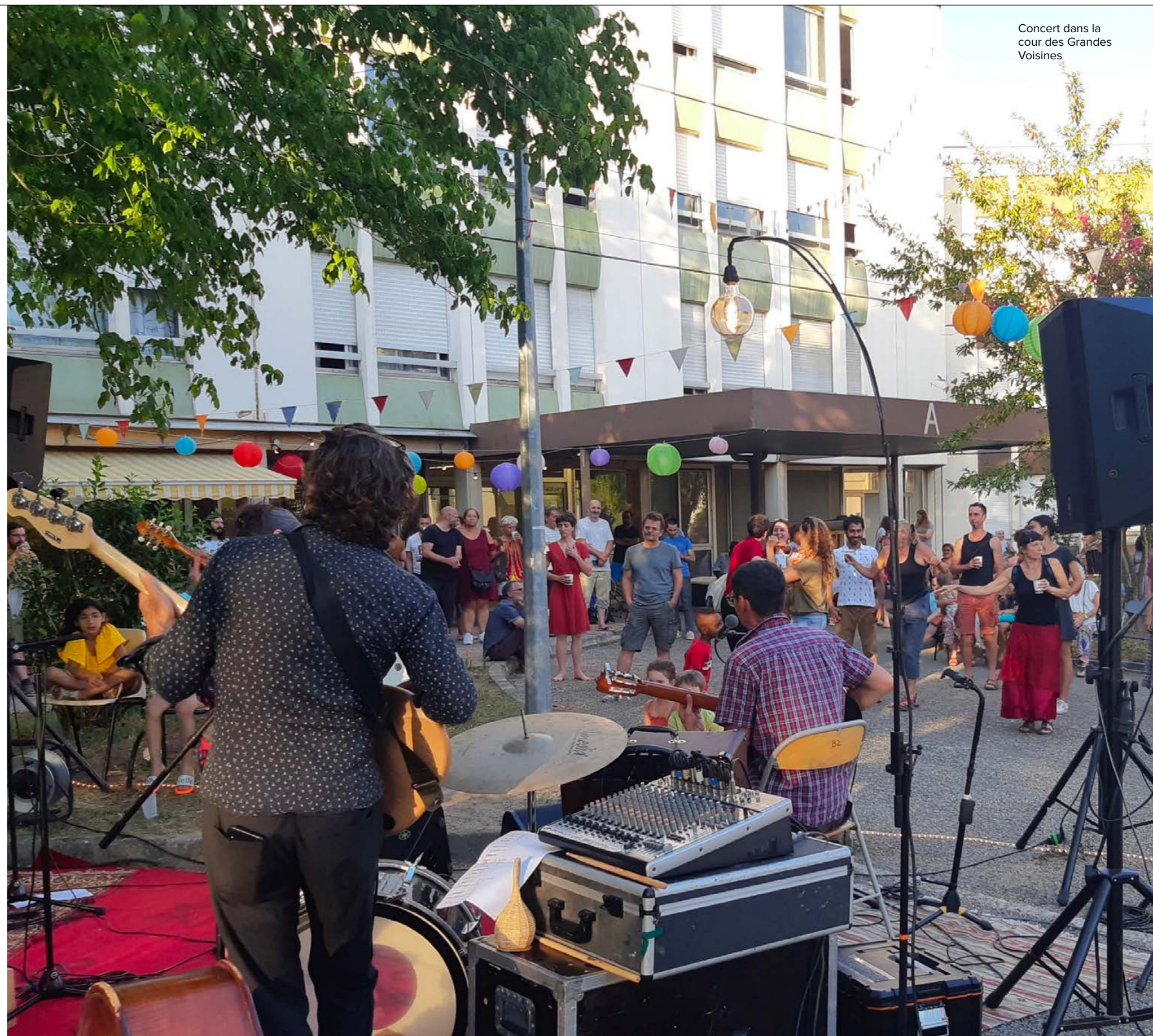
Concert dans la cour des Grandes Voisines