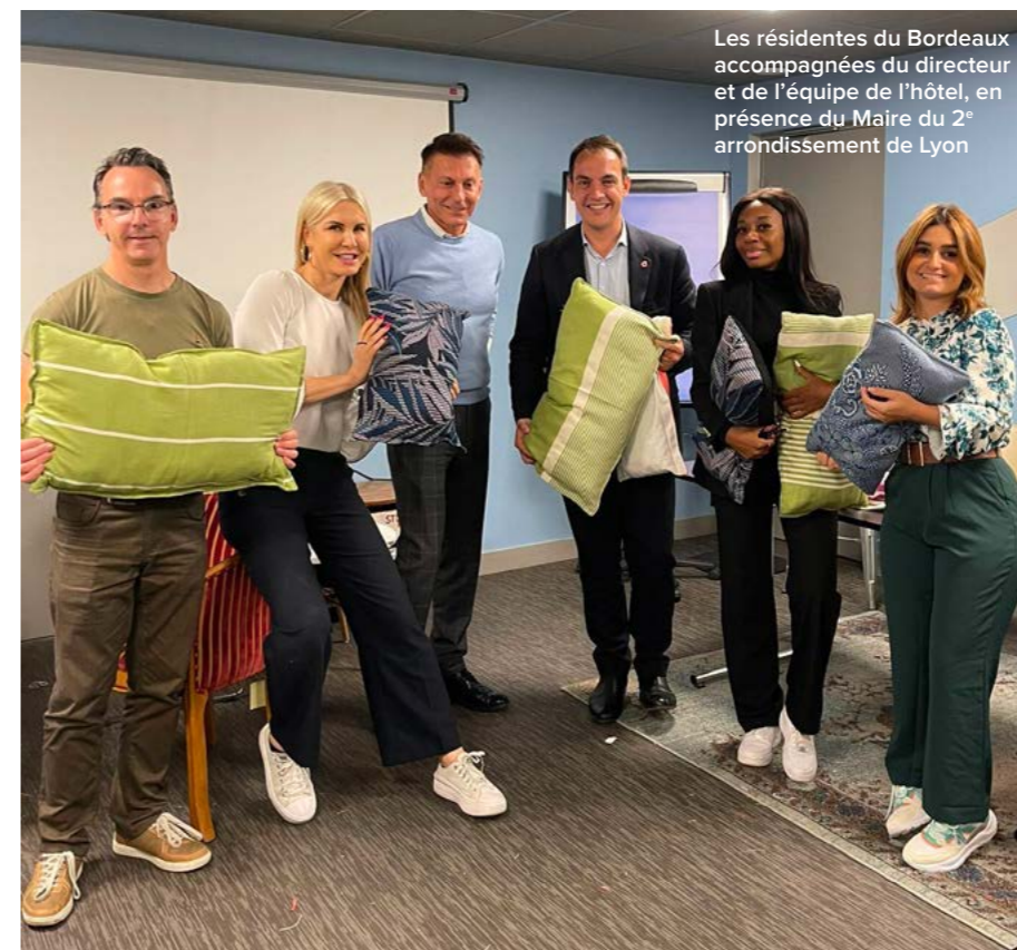
Les résidentes du Bordeaux accompagnées du directeur et de l'équipe de l'hôtel, en présence du Maire du 2 e arrondissement de Lyon