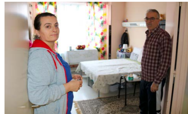
DOSSIER : LES GRANDES VOISINES L'ancien hôpital de Francheville a été transformé en lieu d'accueil. A lieu exceptionnel, projet exceptionnel. P. 16 À 23