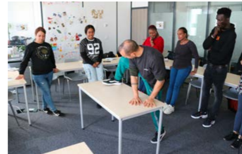
Dans les coulisses du retour à l'emploi P. 10