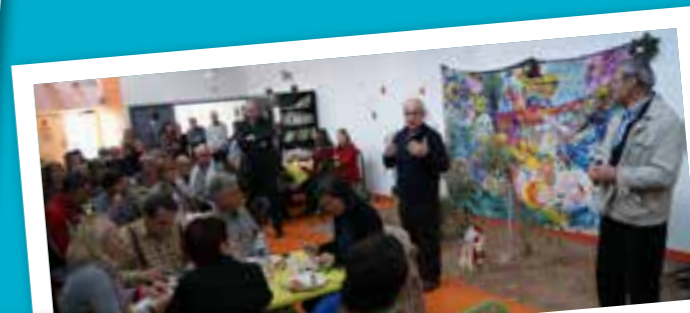
■ 17 DÉCEMBRE 2015 : Repas de Noël avec les Passagers de VILLEFRANCHE-SUR-SAÔNE.