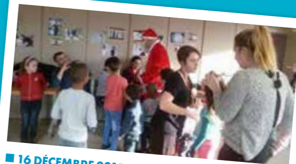
■ 16 DÉCEMBRE 2015 : Goûter de Noël avec les Familles de l'Antenne de CALUIRE ET CUIRE.