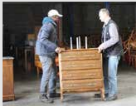
ATELIER TRI OBJETS