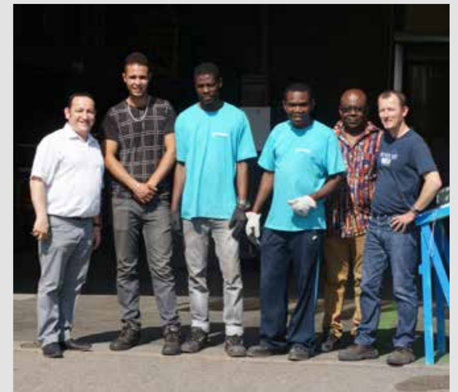
UNE PARTIE DE L'ÉQUIPE DE L'ACI