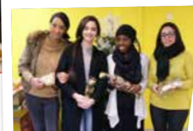
■ 18 DÉCEMBRE 2015 : Remise de la collecte organisée par les élèves de l'école Clemenceau.