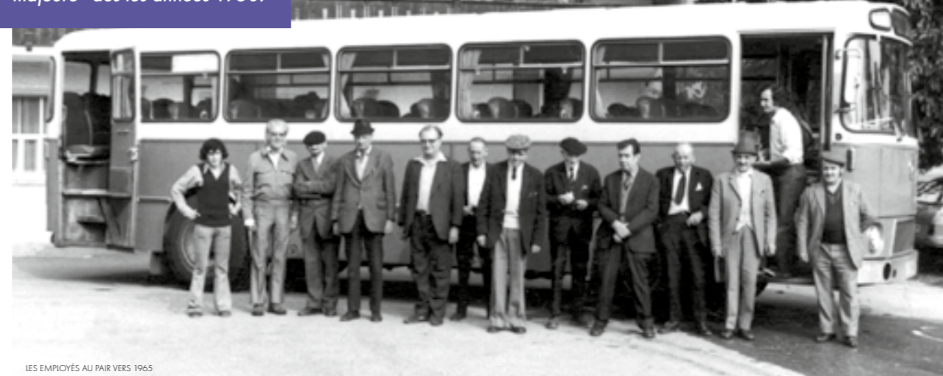
LES EMPLOYÉS AU PAIR VERS 1965

Aux hommes sans abri qui étaient de passage pour un hébergement de nuit, et à ceux qui le désiraient, il était proposé de rester dans la maison; de « Passagers », ils devenaient « Hôtes ».