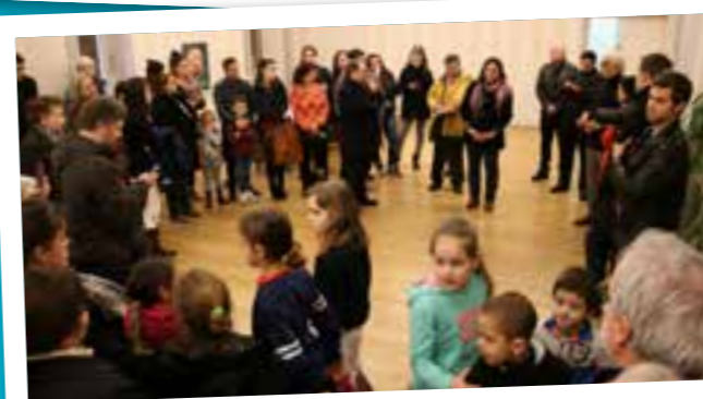
■ 25 JANVIER 2016 : Soirée de bienvenue à la Mairie de Lyon 1 er pour les familles hébergées au Fort Saint LAURENT.