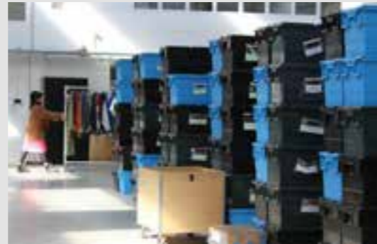
ATELIER TRI TEXTILE