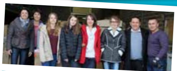
■ 11 MARS 2016 : Remise d'une collecte de jouets organisée par les lycéennes de Champagnat (SAINT SYMPHORIEN SUR COISE)