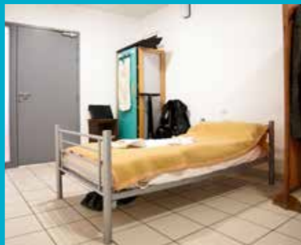
CHAMBRES DE L'HÉBERGEMENT D'URGENCE