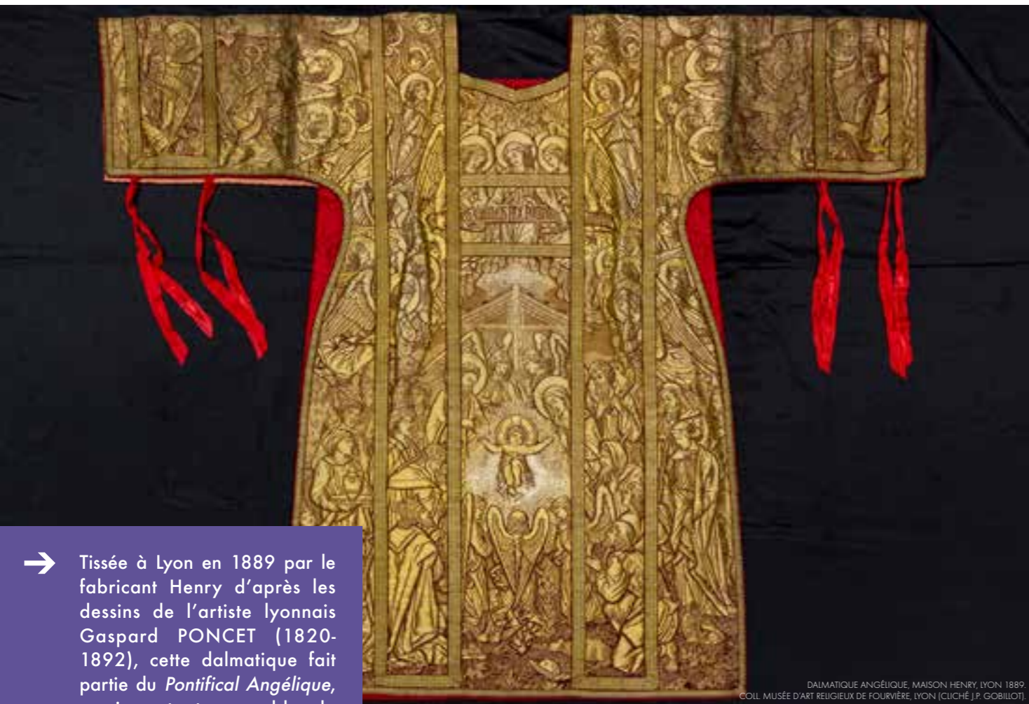
DALMATIQUE ANGÉLIQUE, MAISON HENRY, LYON 1889. COILL. MUSÉE D'ART RELIGIEUX DE FOURVIÈRE, LYON

DALMATIQUE ANGÉLIQUE DE LA MAISON DE SOIERIE LYONNAISE HENRY (1871-1907) CONSERVÉE AU MUSÉE D'ART RELIGIEUX DE FOURVIÈRE À LYON