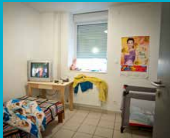
CHAMBRE POUR UNE MAMAN ET SON ENFANT