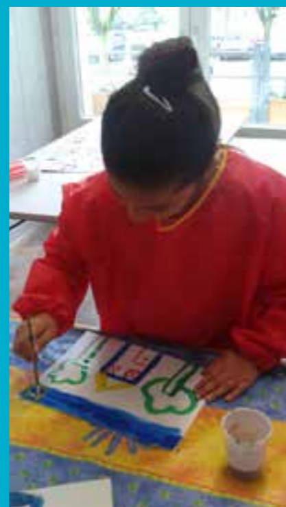
TEMPS D'ANIMATION À L'ANTENNE FAMILLES

L'ARCHE: Merci beaucoup. Nous ne tarderons pas à venir vous revoir pour mieux comprendre ce que LE FOYER met en œuvre dans ses diverses structures au service des familles.