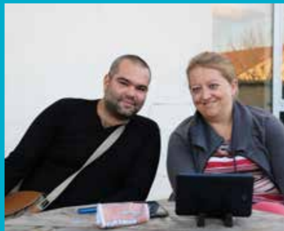
UN COUPLE DE PASSAGERS DU CENTRE D'HÉBERGEMENT D'URGENCE

Puis elle conclut : « Le pire pour nous, ce qui peut rendre notre travail très difficile, ce sont les personnes qui sont dans le déni, dans la fuite, avec qui on ne peut pas travailler en confiance. »