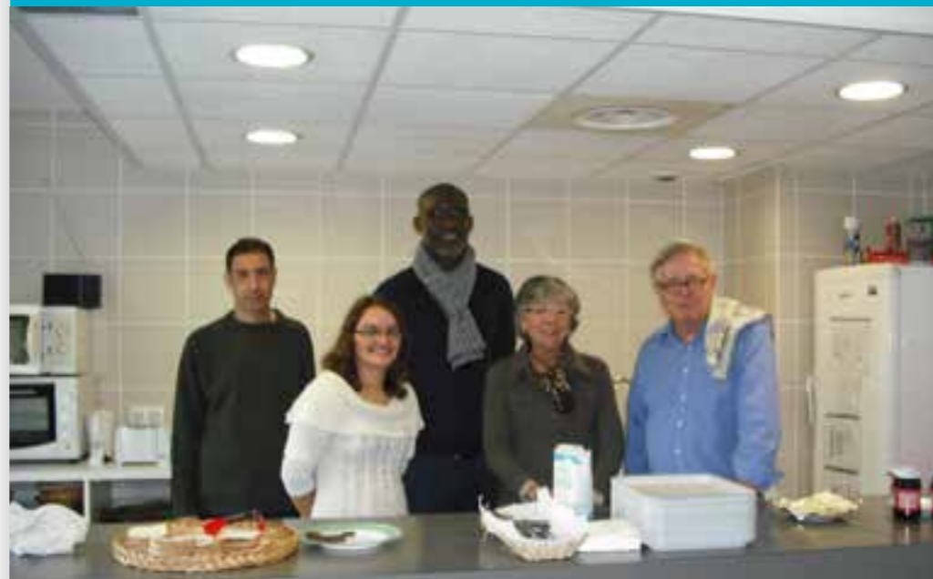
ACCUEIL LA MAIN TENDUE

Activité solidaire animée par 80 bénévoles.