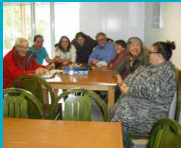
ACCUEIL LA MAIN TENDUE