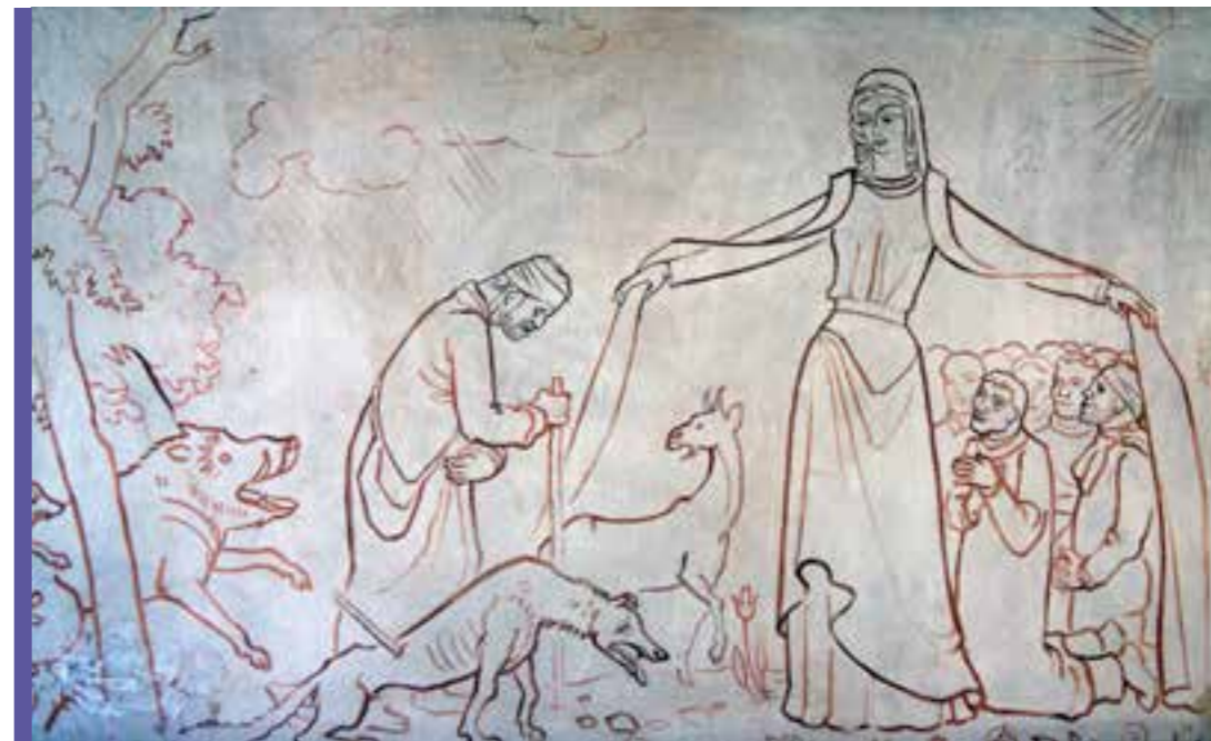
FRESQUE DE LUC BARBIER SITUÉE DANS L'ESPACE GABRIEL ROSSET