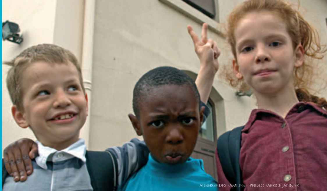
AUBERGE DES FAMILLES