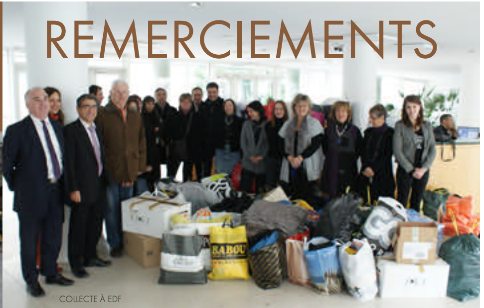
COLLECTE À EDF