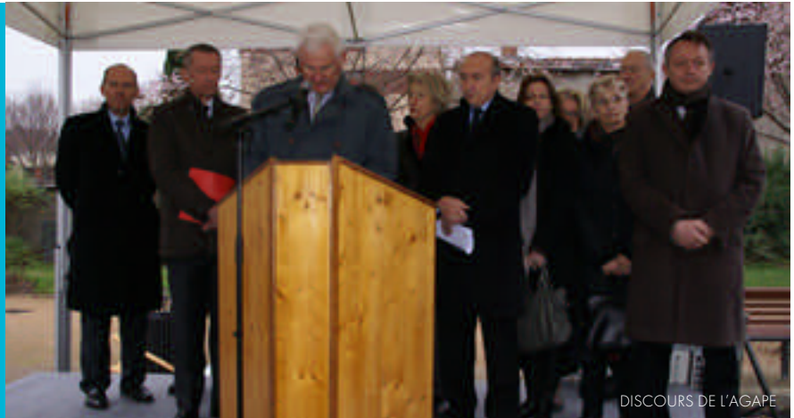
DISCOURS DE L'AGAPE