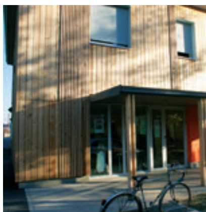
2010 - OUVERTURE DU PÔLE D'ACTIVITÉS DE VILLEFRANCHE SUR SAÔNE