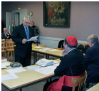
2006 - DEPOT DU DOSSIER POUR LE PROCÈS DE BÉATIFICATION DE G. ROSSET