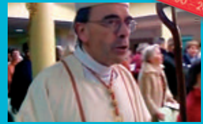
MESSE DE NOËL AU FOYER

- Le 21 décembre , les membres du FOYER et les Artistes de CITÉCRÉATION invitaient tout un chacun à participer à l'inauguration de la FRESQUE DU FOYER sur les murs du Centre Gabriel ROSSET (Voir Pages 10 et 11).