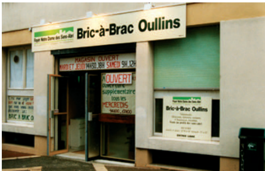
1996 - OUVERTURE DU BRIC A BRAC D'OULLINS

- Organisation de la première « Marche de la Solidarité » .