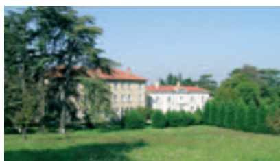
2008 - LA CHARDONNIÈRE A FRANCHEVILLE