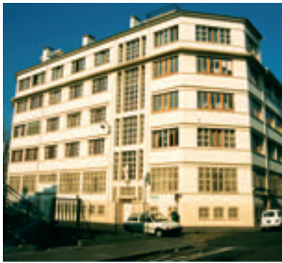
2000 - LE CENTRE GABRIEL ROSSET AVANT LES TRAVAUX