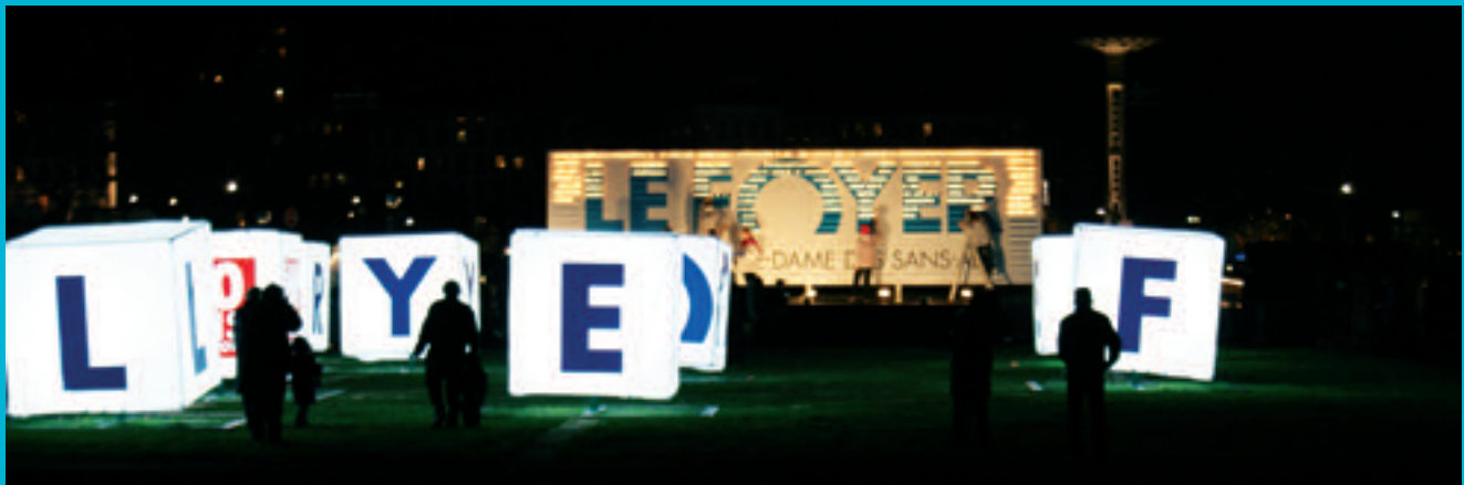
LUMIGNONS DU CŒUR

MERCI à toutes celles et ceux qui ont rendu possible cette belle année de manifestations !