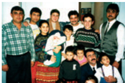
1995 - ACCUEIL DE PERSONNES ROUMAINES TSIGANES AU FOYER MICHELET