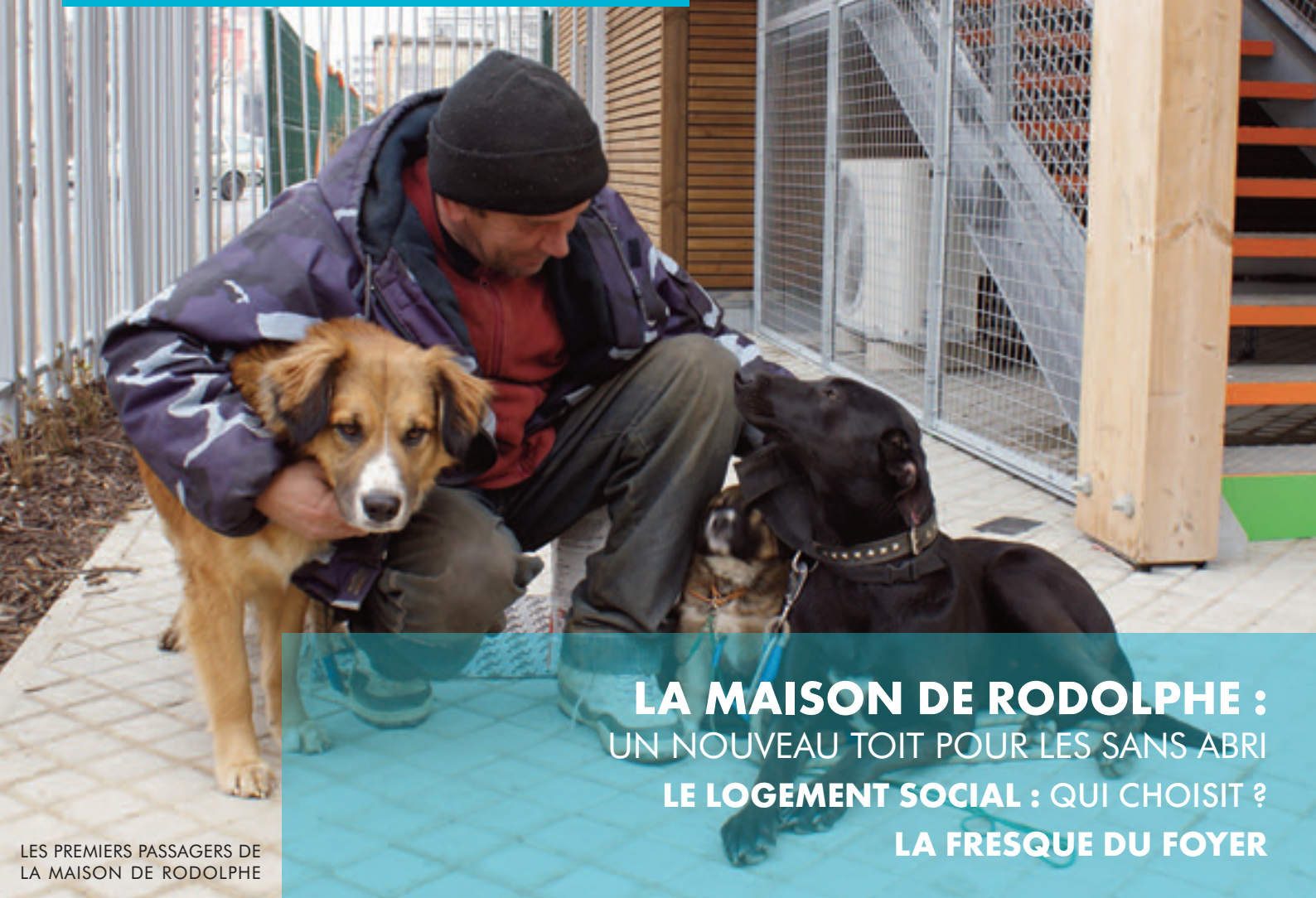
LES PREMIERS PASSAGERS DE LA MAISON DE RODOLPHE

REVUE TRIMESTRIELLE EDITEE PAR LE FOYER NOTRE-DAME DES SANS-ABRI 2,5€