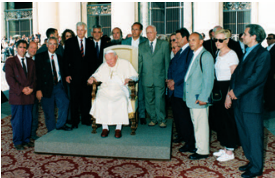
2001 - VOYAGE À ROME ET RENCONTRE AVEC LE PAPE

- À l'occasion des 50 ans de l'association , une délégation du FOYER est reçue par le Pape Jean-Paul II à Rome qui, Place Saint Pierre, invite publiquement LE FOYER à « Continuer, développer et multiplier son action en faveur des plus pauvres ». - Voyage du cinquantenaire pour 60 passagers pendant 8 jours. - La SA d'HLM G. ROSSET loge 1.168 locataires dont 53 % sont des ménages avec enfants, dans 28 communes de l'agglomération.