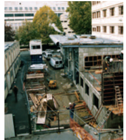
2002 - TRAVAUX DU CENTRE GABRIEL ROSSET

- Inauguration du Centre Gabriel ROSSET (Rue Père Chevrier Lyon 7 ème ) par Nelly OLLIN Ministre déléguée à la lutte contre la précarité et l'exclusion. - Reprise de l' Accueil de Jour Saint-Vincent (Lyon 5 ème ). - Déménagement de l' Atelier et Chantier d'Insertion Centre de Tri Textile rue de Toulon (Lyon 7 ème ) afin de traiter les 1000 tonnes reçues. - Ouverture du Vestiaire d'Urgence Rue Sébastien Gryphe Lyon 7 ème . - Lancement de l'opération de Mécénat « LES ARBRES DE LA SOLIDARITE ».