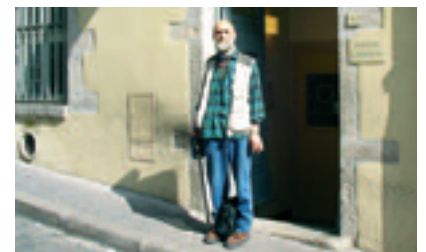
2004 - REPRIS DE L'ACCUEIL DE JOUR SAINT VINCENT