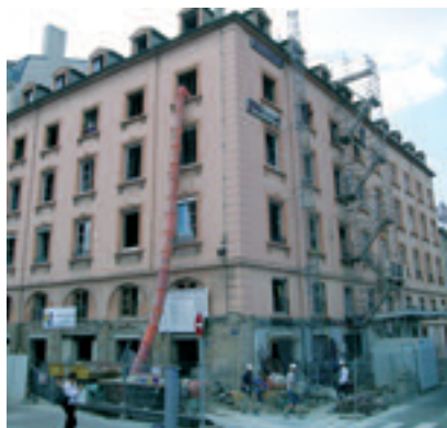
2005 - RÉNOVATION DE LA RESIDENCE LE BORDEAUX