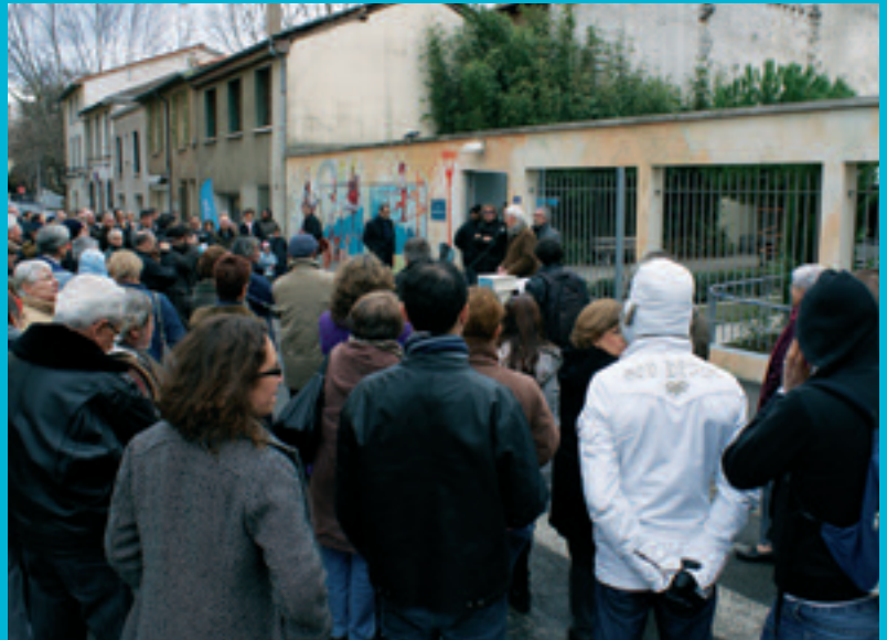
INAUGURATION DE LA FRESQUE DU FOYER

- Le 21 décembre , les membres du FOYER et les Artistes de CITÉCRÉATION invitaient tout un chacun à participer à l'inauguration de la FRESQUE DU FOYER sur les murs du Centre Gabriel ROSSET (Voir Pages 10 et 11).