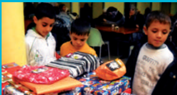
NOËL POUR LES ENFANTS