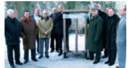
2004 - PLANTATION D'ARBRES DE LA SOLIDARITE AVEC LE COMITÉ DES AMIS