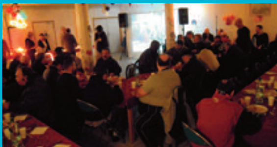
NOËL À LA CHARDONNIÈRE