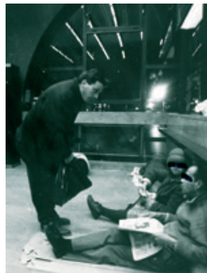
1995 - VEILLE SOCIALE

- Dissolution du GEPAL , qui avait pour mission d'assurer toutes les fonctions découlant de la gestion du patrimoine rassemblé du FOYER NOTRE-DAME DES SANS-ABRI et de la SA d'HLM G. ROSSET.