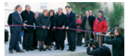
2004 - INAUGURATION DU CENTRE GABRIEL ROSSET