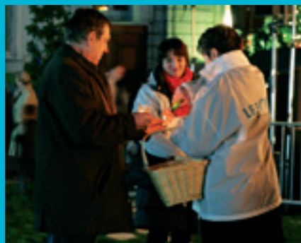
LUMIGNONS DU CŒUR