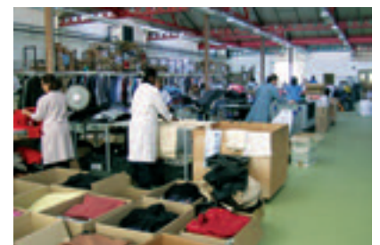
2004 - ATELIER DE TRI TEXTILE RUE DE TOULON