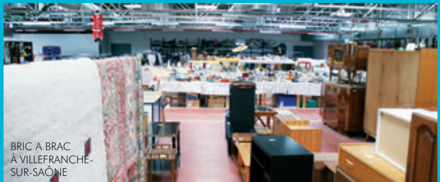
BRIC A BRAC À VILLEFRANCHE- SUR-SAÔNE

- Du 15 au 21 novembre , grâce au soutien de la Fondation SEB, LE FOYER a bénéficié d'une semaine spéciale sur les ondes de la radio RCF. Tout au long des émissions, les auditeurs ont pu apprécier les actions menées au FOYER au travers des reportages de terrain à la Résidence Le Bordeaux ou au Centre Gabriel ROSSET, un débat avec les organisateurs du colloque sur l'accompagnement, une émission consacrée à l'accueil des personnes