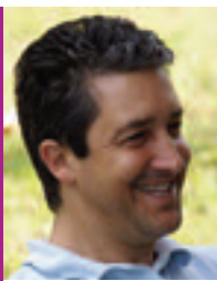
© - Fédération de L'Arche en France

L'actualité économique nous rappelle presque chaque jour que pour survivre il faut se développer, absorber, fusionner pour être de plus en plus important et écraser son concurrent. On aurait pu croire ou espérer que le monde médico-social échappe à cette logique. Paradoxalement, il n'en est rien. L'endettement de l'État, la réduction d'effectifs conduisent les administrations à vouloir limiter le nombre de leurs interlocuteurs. Il s'en suit une pression sur les organisations pour qu'elles se regroupent, mutualisent ou fusionnent. Certains départements (qui nous octroient les financements publics dont nous avons besoin pour l'accompagnement des personnes accueillies dans nos communautés) nous disent qu'à moins de 300 salariés par association nous n'aurions pas la taille nécessaire à notre survie (or l'effectif moyen des salariés dans une communauté de L'Arche se situe entre 20 et 40 sala-