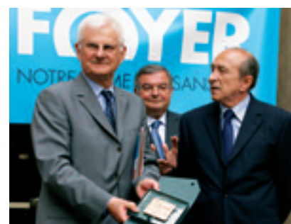
2010 - REMISE DE LA MÉDAILLE DE LA VILLE DE LYON POUR LES 60 ANS DU FOYER