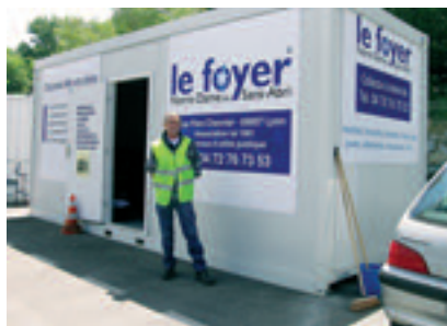
2006 - OUVERTURE DE LA PREMIÈRE RECYCLERIE