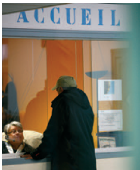
CENTRE GABRIEL ROSSET

Depuis plusieurs mois, la demande d'hébergement est en forte augmentation.