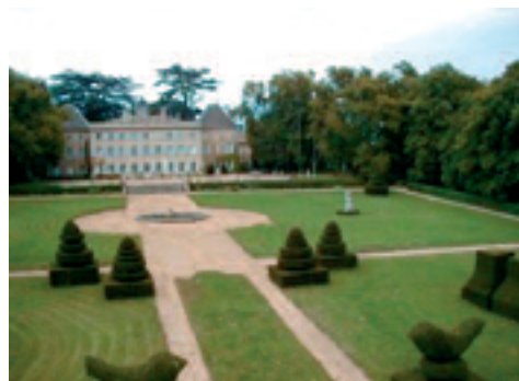
CHÂTEAU DE LONGSARD

Nous tenons à remercier tous les propriétaires, et plus spécialement ceux de « La Louvière » qui ont fait appel à un pianiste pour agrémenter la soirée, ceux de « La Grange des Maures » qui ont organisé une exposition de sculpture, ceux « du jardin des Roches » dont les enfants en souvenir de leur mère décédée accidentellement dans la semaine ont eu la grande gentillesse d'ouvrir le jardin, comme elle le désirait. Enfin, merci aux propriétaires qui ont organisés des circuits ou des activités pour leurs groupes d'amis ou ceux encore qui ont offerts des rafraîchissements... ■