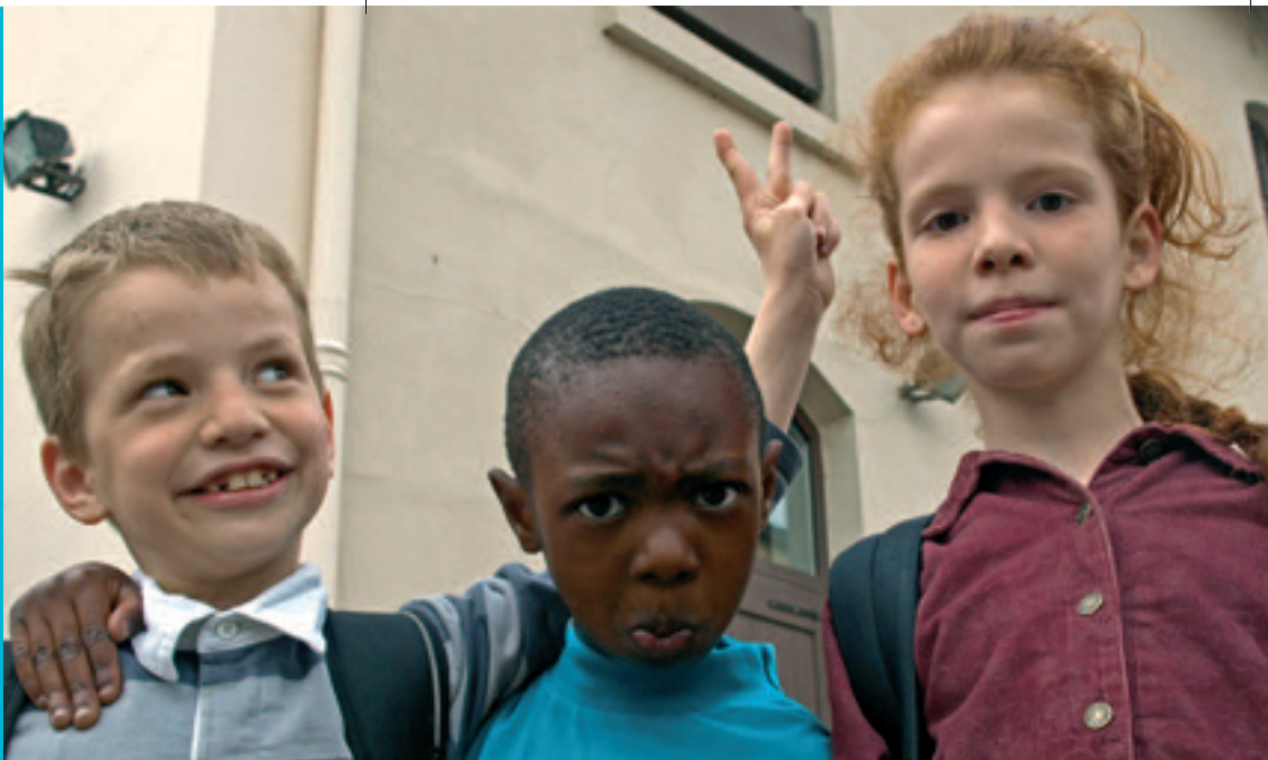
Auberge des Familles