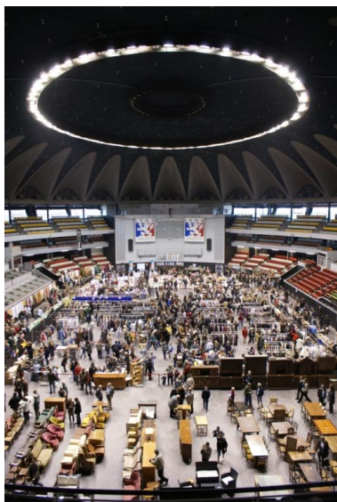
JOURNEES D'ENTRAIDE DU FOYER AU PALAIS DES SPORTS DE GERLAND LE WEEK-END DU 5 ET 6 NOVEMBRE 2011